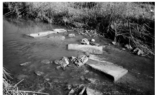
옛 배다리 석재(1996)